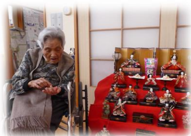
ひなあられもおいしい