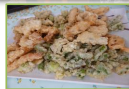
天ぷら盛り合わせ