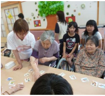
熱戦のカルタとり！