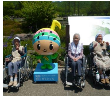
初夏の一日を満喫♪

この日は天候に恵まれ、青空の下で食べるアイスクリームは「味が濃くておいしい。」と、味も格別のようでした。