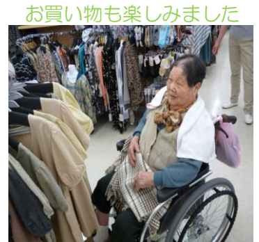
お買い物も楽しみました