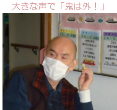
大きな声で「鬼は外！」

2月1日金曜日、豆まきを行ないました。 年男・年女の職員が各居室をまわり、利用者の皆さんと共に豆をまきました。 また、午後からは茶話会が行なわれ、皆で恵方巻や福豆お菓子を味わいながら、今年一年の無病息災をお祈りしました。