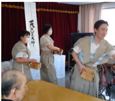
袴姿の年男・年女