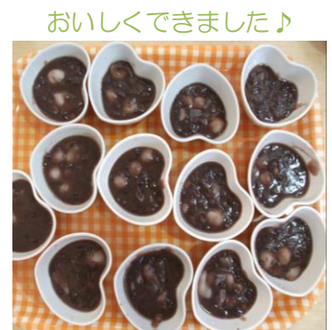
おいしくできました♪