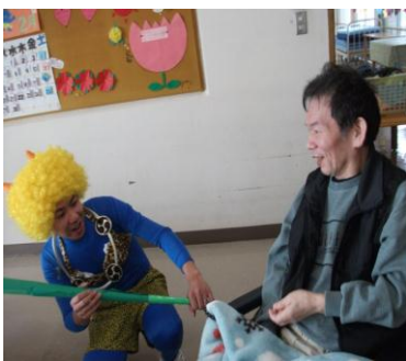
豆をまいて鬼退治！