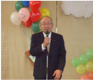
* 華やかな開会式 *