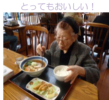
とってもおいしい！

美しい紅葉を眺めたり、会津名物ソースカツ丼の味と肉の厚みに感激されたりと、楽しい思い出がたくさんできました。