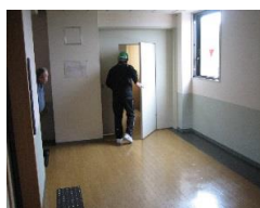
5/20 日直休日体制避難訓練