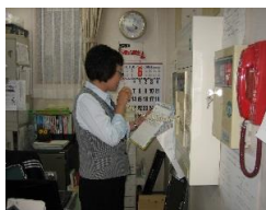
6/14 日直休日体制避難訓練