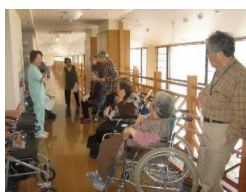
4/27 各階ごとに避難経路の説明 深夜・夜間体制避難訓練