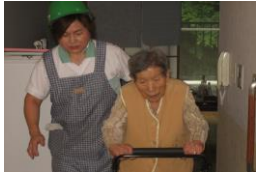
日直休日体制避難訓練