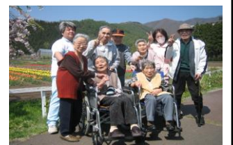
皆さんで『ハイポーズ』！！