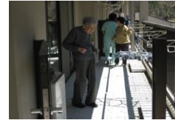
避難用スロープ訓練