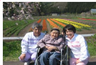
リステルのチューリップ